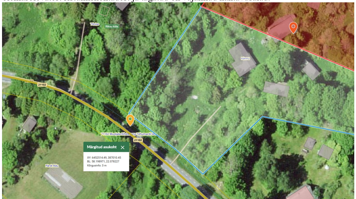
Joonis 1. Ristumiskoha asukoht tähistatud oranži tingmärgiga.